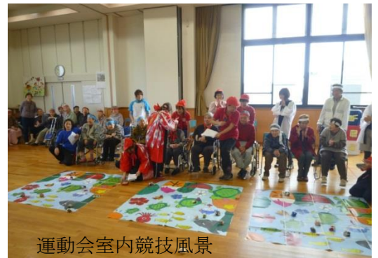
運動会室内競技風景

グループホームでは3事業所合同で日帰り旅行を企画しております。伊勢神宮、名古屋港水族館、関町・鈴鹿峠などへ出向いています。