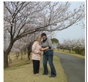
筆者とつくしんぼの 謳い手Mさん