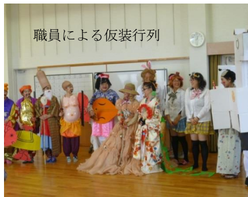
職員による仮装行列