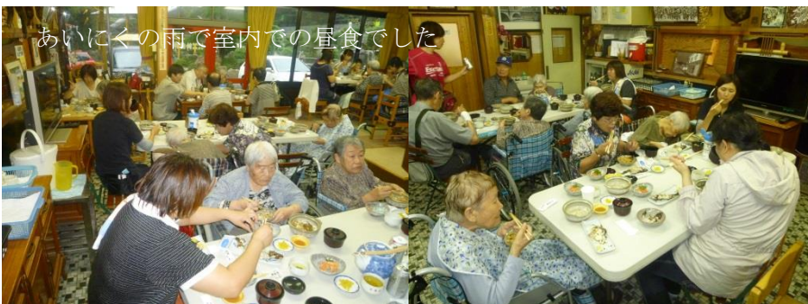
あいにくの雨で室内での昼食でした