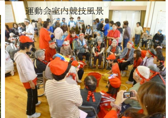
運動会室内競技風景